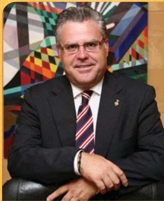
PERE Granados Carrillo, Alcalde de Salou