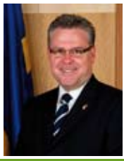
PERE GRANADOS CARRILLO ALCALDE DE SALOU