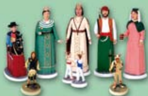
Reproduccions dels elements festius en miniatura