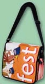
Bosses de festa major