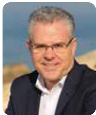
Pere Granados Alcalde de Salou