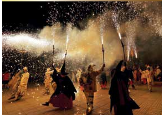
Diables i Bruixes de Salou.