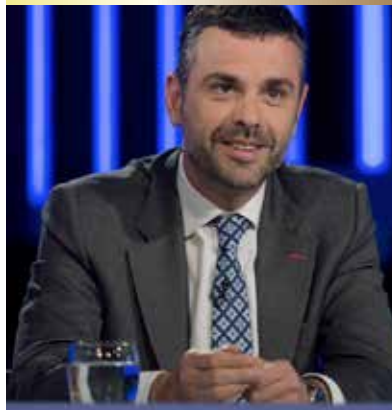
Hble. Sr. Santi Vila i Vicente.