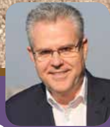
Pere Granados Alcalde de Salou